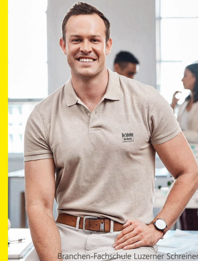
Branchen-Fachschule Luzerner Schreiner